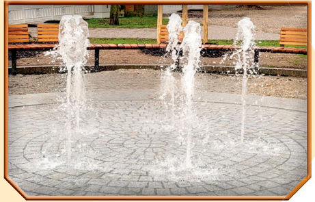
Wasserspiel mit Sitzgelegenheit