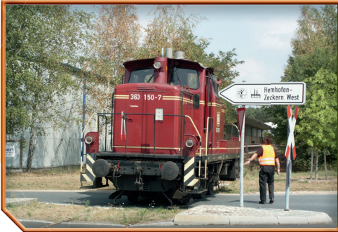
Bahnhof zu aktiven Zeiten des Personenverkehrs