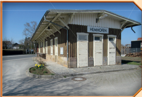
Alter Bahnhof mit Bahnhofsgelände vor der Sanierung